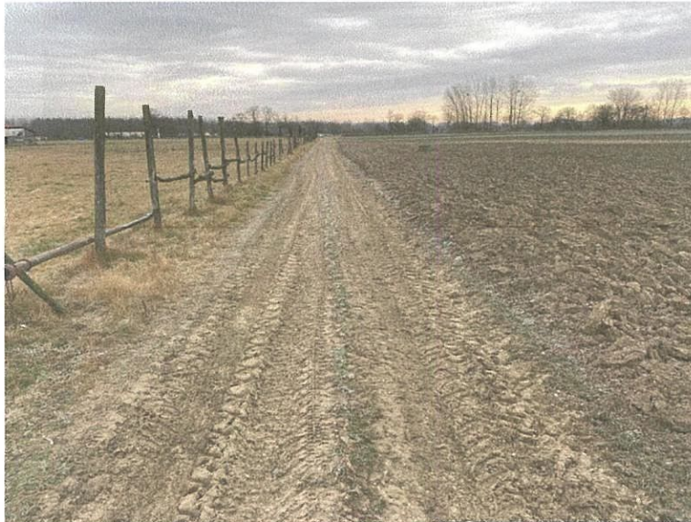
A terület déli határa keletről és nyugatról fotózva