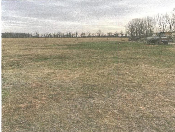
A vizsgálat tárgyát képező területtől délre