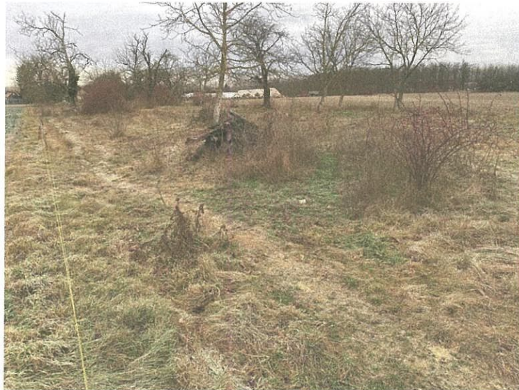
Maga a vizsgált, de bejárhatatlan parcella