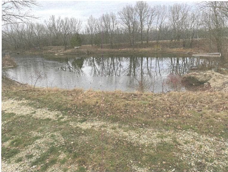
Az ingatlanon lévő tó, illetve a keletre lévő szántó