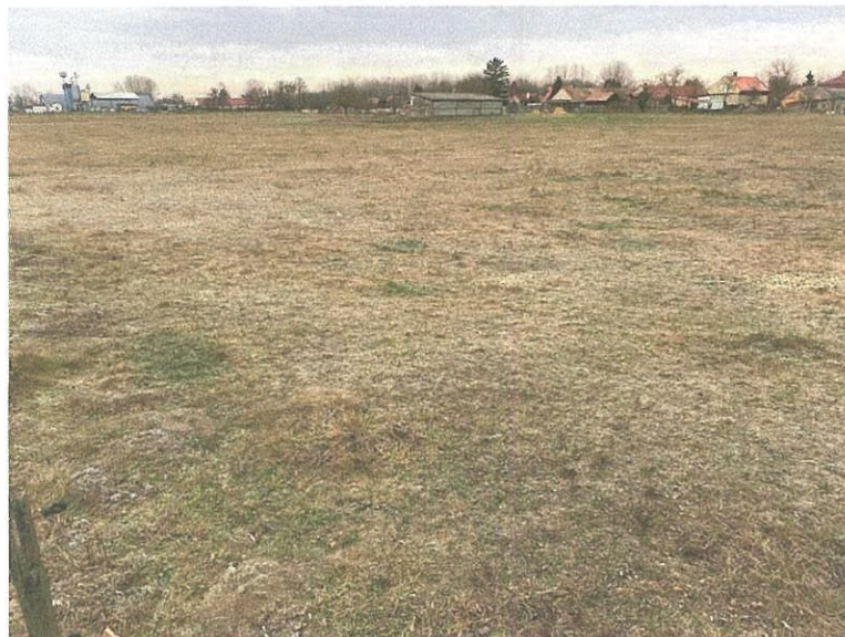
Maga a vizsgálat tárgyát képező terület