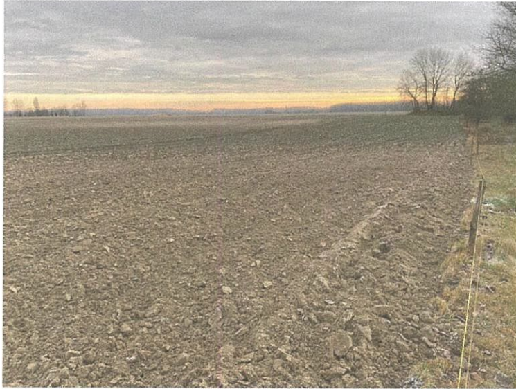
A vizsgált terület keleti, járható szántott szomszédos parcellája

formavilága mutatkozott meg, komoly váltással- roppant intenzíven kavicsossá vált felszínnel.