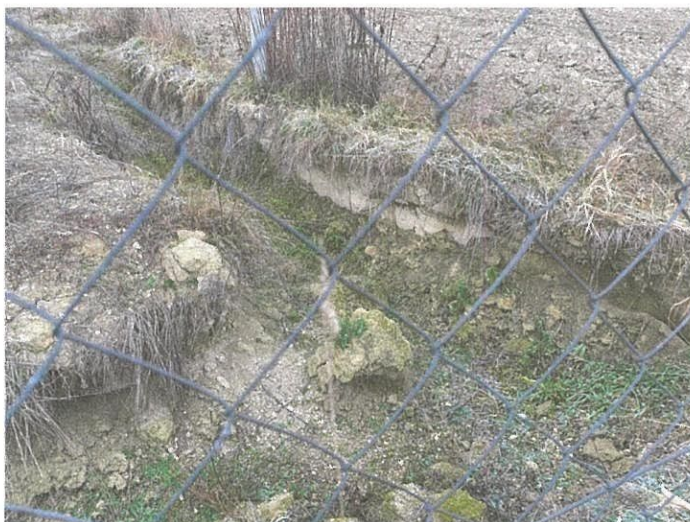
A déli telek télen található földmunka régészeti jelenség nélkül