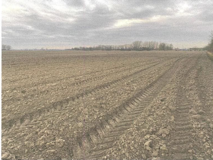
Lickó-pusztától délre, a bejárható szántók