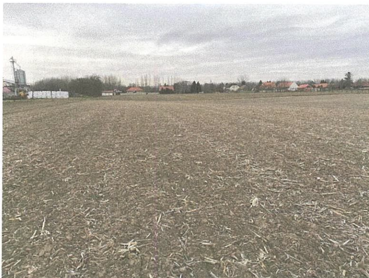
A szántott terület, a fényképen is jól érzékelhető mederrel