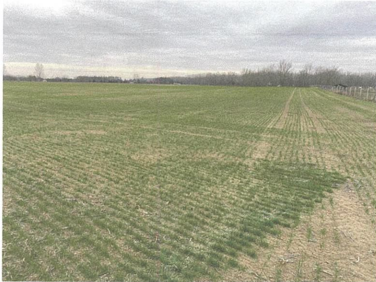
A nyugati szántó, háttérben a lelőhely