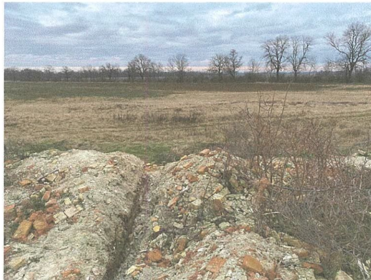
A bolygatás nyomai és a „téglabánya” az épületeknél

2023. novemberének végén kiegészítő terepbejárást tartottunk a felmerült új szempontok ismeretében. A bejárás napos, de szeles időben, és masszív fagy mellett történtek. A fentiek miatt a szürke deres talajfelszín nem volt kimondottan ideális a régészeti célú bejárások lefolytatására.