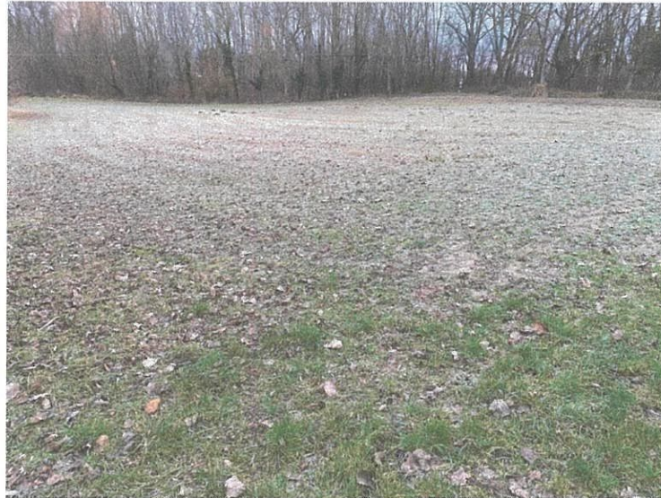
A Tánicsics utcai hátsó kertek a lelőhelyel