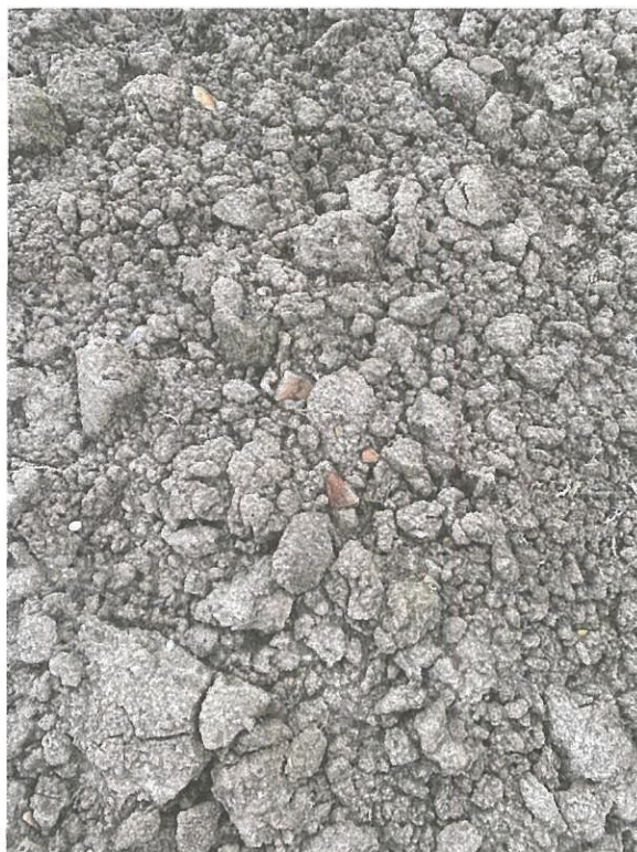
Régészeti korú cserepe a szántásban, és megmosva