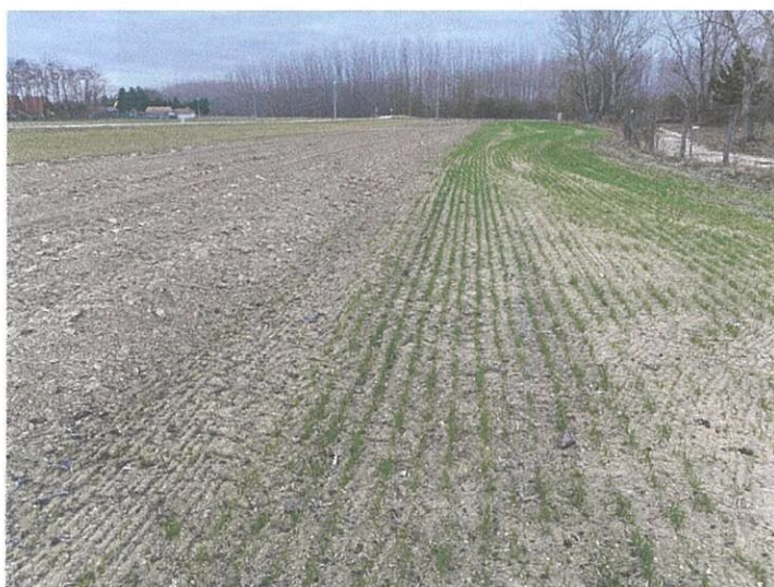
A nyugati szántó, már a régészeti lelőhellyel és a vízvédelmi úttal