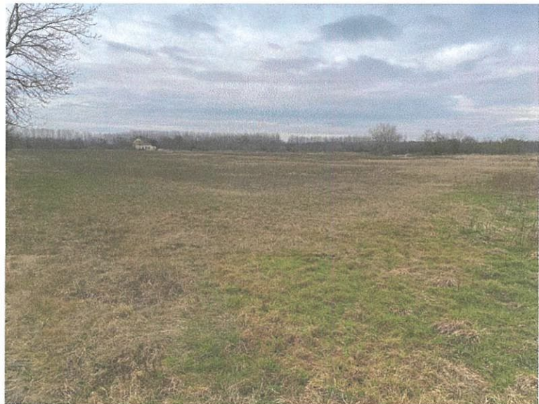
Lickó-pusza keletről, a füves területtel